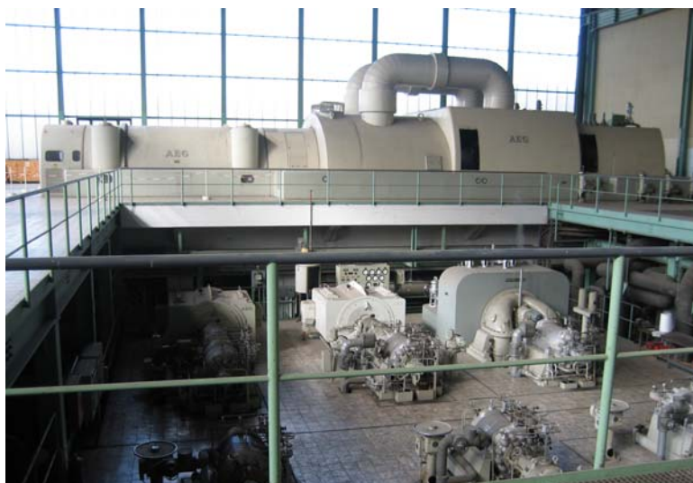
Машинный зал эл.станции Wallheim, Германия, построенной AEG.

Теперь у клиентов AEG снова есть, куда обратиться. На оборудованных AEG кораблях, железных дорогах, электростанциях, машиностроительных, сталеплавильных, сталепрокатных и цементных заводах, муниципальных объектах производится обслуживание, модернизация и обучение на высшем техническом уровне.