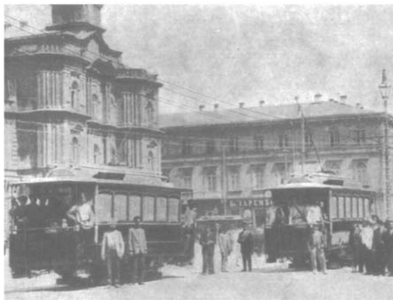
Kiew: Die erste elektrische Bahn des russischen Reiches (1893).

Киев. Первая электрическая железная дорога Русской империи (1893 г.)